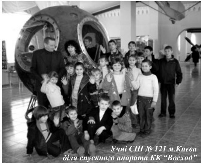
Учні ШШ № 121 м. Києва біля спускного апарата КК «Восход»