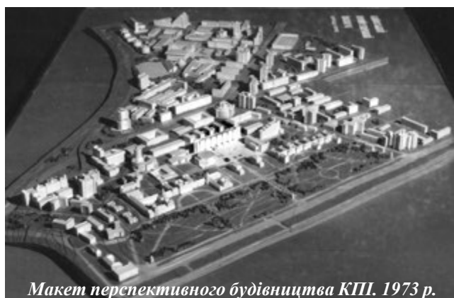
Макет перспективного будівництва КПІ. 1973 р.