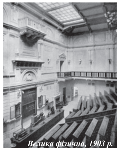
Велика фізична, 1903 р.

Общее впечатление, оставляемое этой аудиторией, очень приятное. Читая и проводя в ней демонстрации легко и удобно. Благодаря массе воздуха и света, даже после трехчасовой работы, не чувствуется большого утомления».