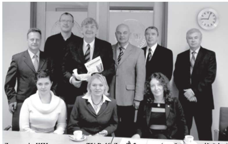
Делегація КПІ з ректором TU Delft Діксом Фоккема (стоїть третій зліва)

Отриманий політехніками досвід дозволяє окреслити напрями необ-