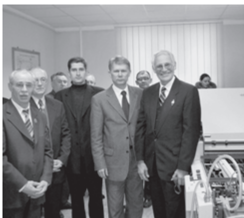
27 січня 2005 р. Передача обладнання фірмою Heidelberg Навчальному центру ВПІ