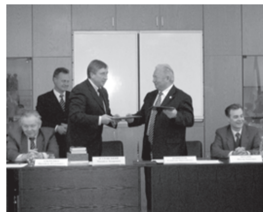
12 травня 2005 р. Підписано договір про співпрацю між НТУУ «КПІ» та ДКБ «Південне»