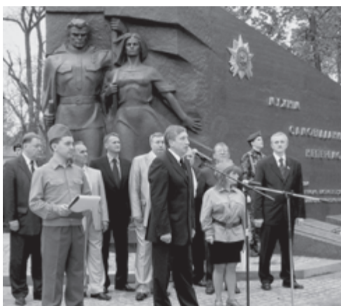
6 травня 2005 р. Урочистості з нагоди святкування 60-річчя Перемоги у Великій Вітчизняній війні