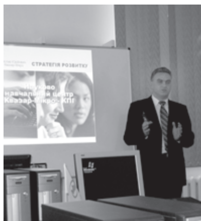
1 квітня 2005 р. Відкриття Науково-навчального центру сучасних технологій «Квазар-Мікро – КПІ»