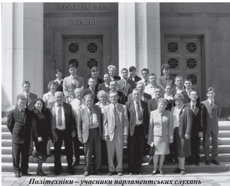
Політехніки – учасники парламентських слухань