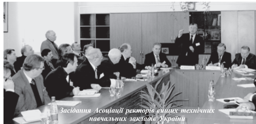
Засідання Асоціації ректорів вищих технічних навчальних закладів України

Академік НАНУ М.З.Згуровський, голова Асоціації ректорів ВТНЗ Украї-