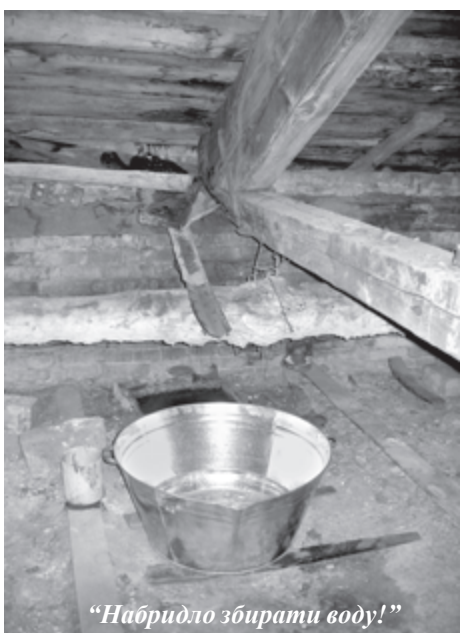
"Набридло збирати воду!"

Однак, ми не залишаємо цю проблему поза увагою – створена спеціальна бригада, яка виконує роботи з очистки даху від снігу. Планом ремонтних робіт на 2005 рік передбачено виконання ремонту покрівлі корпусу №1.