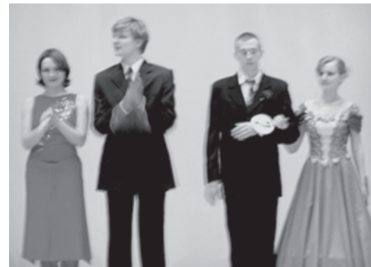
Конкурс "Студентська сім'я КПІ — 2004"

Конкурс "Студентська сім'я — 2004" проводився 13 лютого за участю 6 пар. У напруженій боротьбі пара