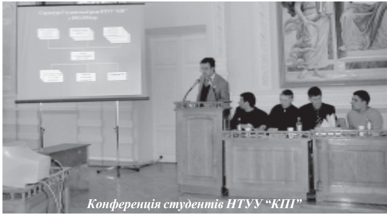
Конференція студентів НТУУ "КПІ"

31 березня була скликана конференція студентів університету – найвищий орган студентського самоврядування. Участь у конференції взяли представники адміністрації, лідери студентських організацій НТУУ "КПІ" та більш ніж 250 делегатів, яким на конференціях студентів факультетів та інститутів було довірено представляти інтереси своїх колег у цьому почесному зібранні.