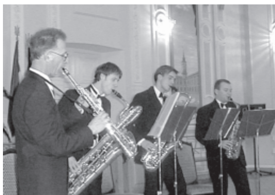
Київський квартет саксофоністів виступає в залі засідань Вченої ради

Призерами всеукраїнських олімпіад серед студентів ВНЗ із різних дисциплін (математика, фізика, інформаційна безпека, обробка металів