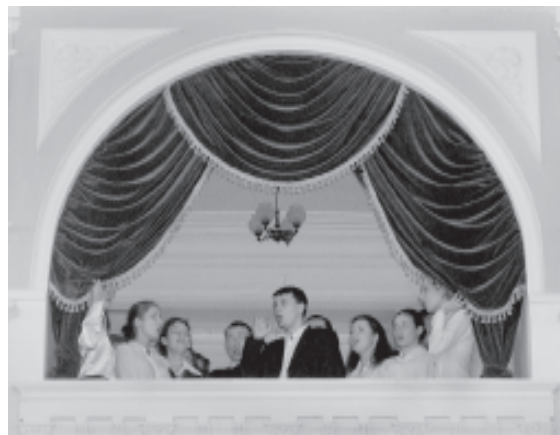
Народна хорова капела КПІ виконує студентський гімн "Gaudeamus" під час урочистого засідання Вченої ради