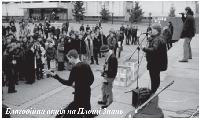
Благодійна акція на Площі Знань

жави. Хоча й існує Державна програма запобігання дитячій бездоглядності на 2003 – 2005 роки, затверджена Указом Президента України від 21 лютого 2003 року, на повне вирішення цього питання годі й сподіватися. Тим паче, статистика теж невтішна, і кількість дітей (бродяг та жебраків) на 1999 рік становила 31,3 тис., на 2001 – 35 тис., на 2003 – 36 тис. Причому, наведені показники – це лише ті безпритульні діти, що були затримані працівниками внутрішніх справ, а реальні цифри значно вищі.