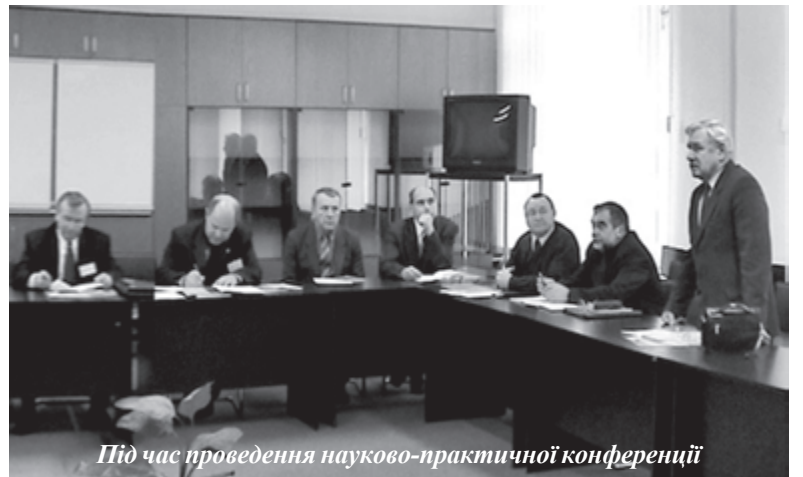
Під час проведення науково-практичної конференції