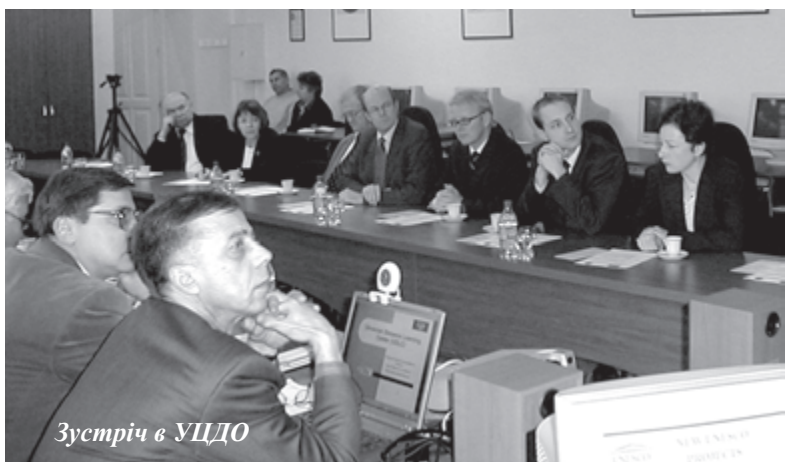
Зустріч в УЦДО

п'ютерної підготовки населення за програмою ECDL («Європейський стандарт комп'ютерної грамотності»).