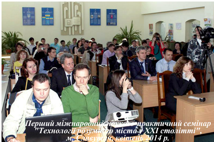
Перший міжнародний науково-практичний семінар "Технології розумного міста у XXI столітті", м. Славутич, квітень 2014 р.

Упродовж своєї діяльності Філія суттєво розвинула матеріально-технічну базу. Завдяки співпраці з World ORT (міжнародна освітня мережа) і Hewlett-Packard (технологічна компанія, США) створено лабораторію інформаційних технологій із сучасним обладнанням, комп'ютерними класами та ресурсними центрами. Освітня і наукова активність посилювалася через реалізацію проєктів і заходів, зокрема завдяки започаткуванню в 2014 р. ініціативи "Година Коду", спрямованої на популяризацію галузі програмування серед учнів. З 2014 р. функціонує міжнародний науково-практичний семінар "Технології розумного міста у XXI столітті", а в 2016-му Філія виступила засновницею міжнародної конференції INUDECO, що стала платформою для обміну досвідом і розвитку партнерств у сфері ядерної та радіаційної безпеки.