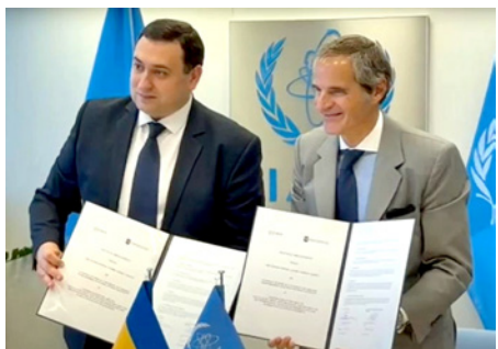
А. Мельниченко та Генеральний директор МАГАТЕ Р. Гроссі, 2025 р.

стор. 1 Підготовка фахівців. У КПІ ім. Ігоря Сікорського завдяки ініціативі та допомозі Міністерства енергетики України, за підтримки міжнародних партнерів зі США, Швеції, Канади та МАГАТЕ в НН ІАТЕ було відкрито першу в Україні магістерську програму "Фізичний захист та облік і контроль ядерних матеріалів" і створено навчально-наукову лабораторію "Фізична ядерна безпека". Навчання майбутніх фахівців здійснюється також на базі профільних інститутів НАНУ, НТЦ ядерної та радіаційної безпеки, інших підприємств галузі.