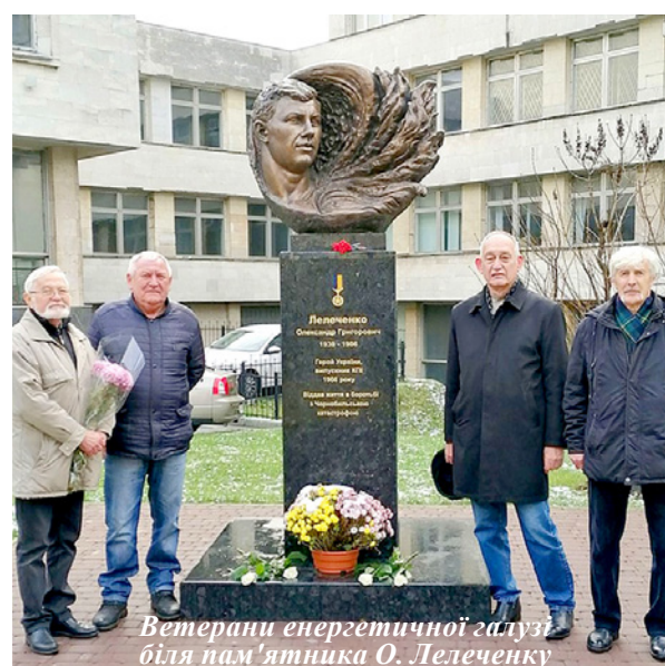
Ветерани енергетичної галузі біля пам'ятника О. Лелеченку

Зокрема, КПІ ім. Ігоря Сікорського став першим закладом вищої освіти України, який співпрацюватиме з МАГАТЕ. У 2025 р., на полях 69-ї сесії Генеральної конференції МАГАТЕ, відбулося урочисте підписання Практичних домовленостей між КПІ та Міжнародним агентством з атомної енергії. Це стало ще одним свідченням високої довіри міжнародного професійного товариства до потенціалу українських закладів вищої освіти та їх здатності робити внесок у розв'язання глобальних викликів у сфері ядерної енергетики і безпеки.