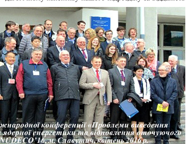
Учасники Першої міжнародної конференції «Проблеми виведення з експлуатації об'єктів ядерної енергетики та відновлення оточуючого середовища» INUDECO '16, м. Славутич, квітень 2016 р.