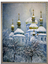
"Аура Софії Київської"