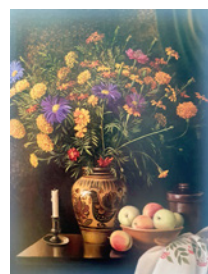
"Букет на Свято Спаса"

Як живописець у своїй творчості Василь Климик використовує насамперед технічні надбання класичного періоду. Звідси – точність і певна гладкість письма, інколи майже ілюзорне відтворення природи, ретельно вибудована та виважена композиція. Романтично-реалістичне зображення зовнішнього світу в його картинах є не лише відображенням авторського бачення та розуміння мистецтва, а й даниною періоду його становлення як митця, корені якого лежать в дитинстві в історичному містечку Чуднів на Житомирщині, та першим урокам малювання, що їх він отримав у студії образотворчого мистецтва художника В'ячеслава Янковського.