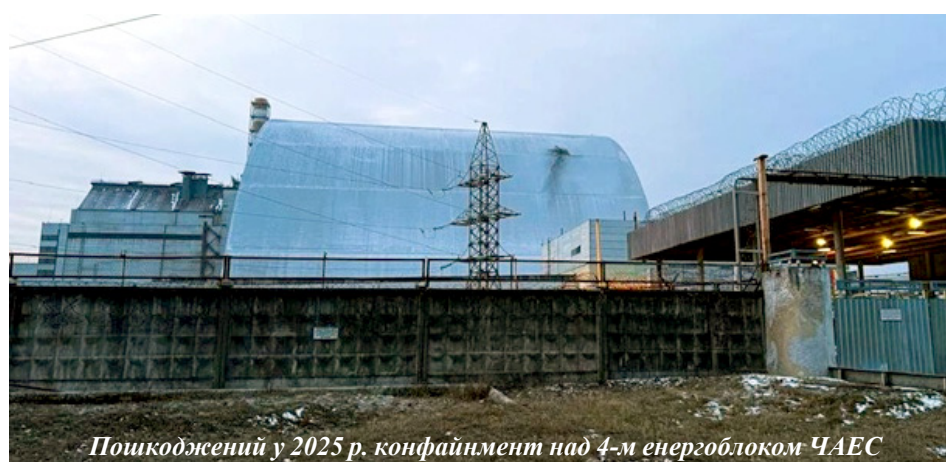
Пошкоджений у 2025 р. конфайнмент над 4-м енергоблоком ЧАЕС

До речі, у створенні банку даних постраждалих внаслідок Чорнобильської катастрофи взяли участь студенти й аспіранти ННІТС під керівництвом професора Лариси Сергіївни Глоби.