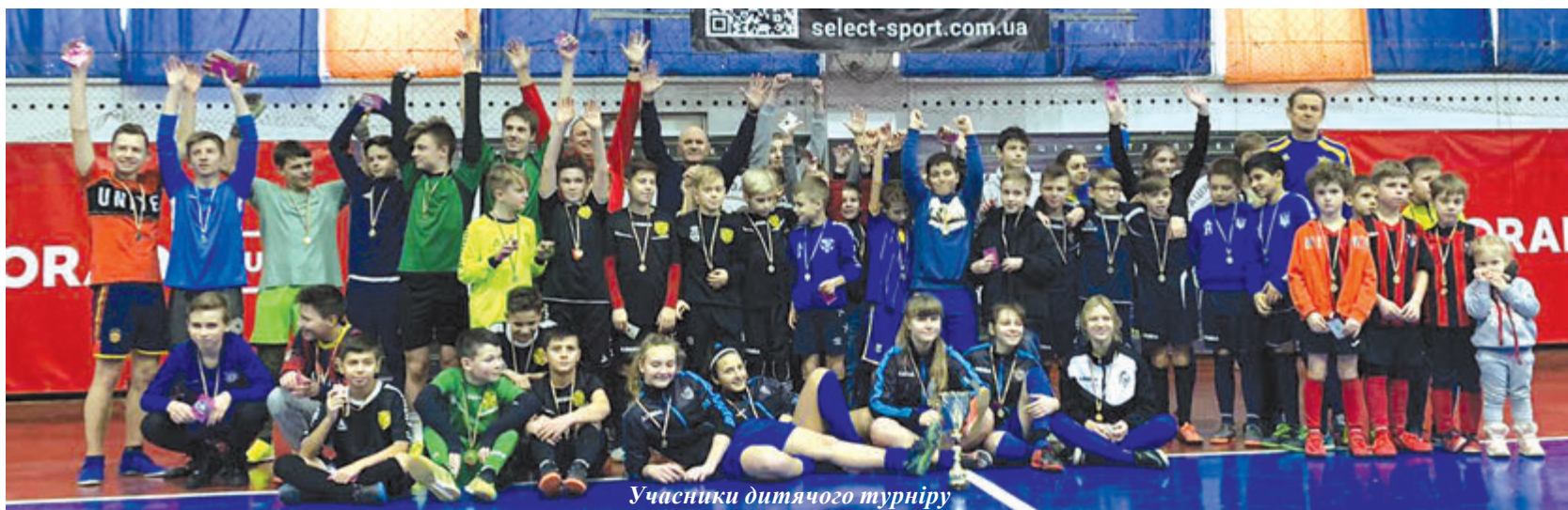
Учасники дитячого турніру