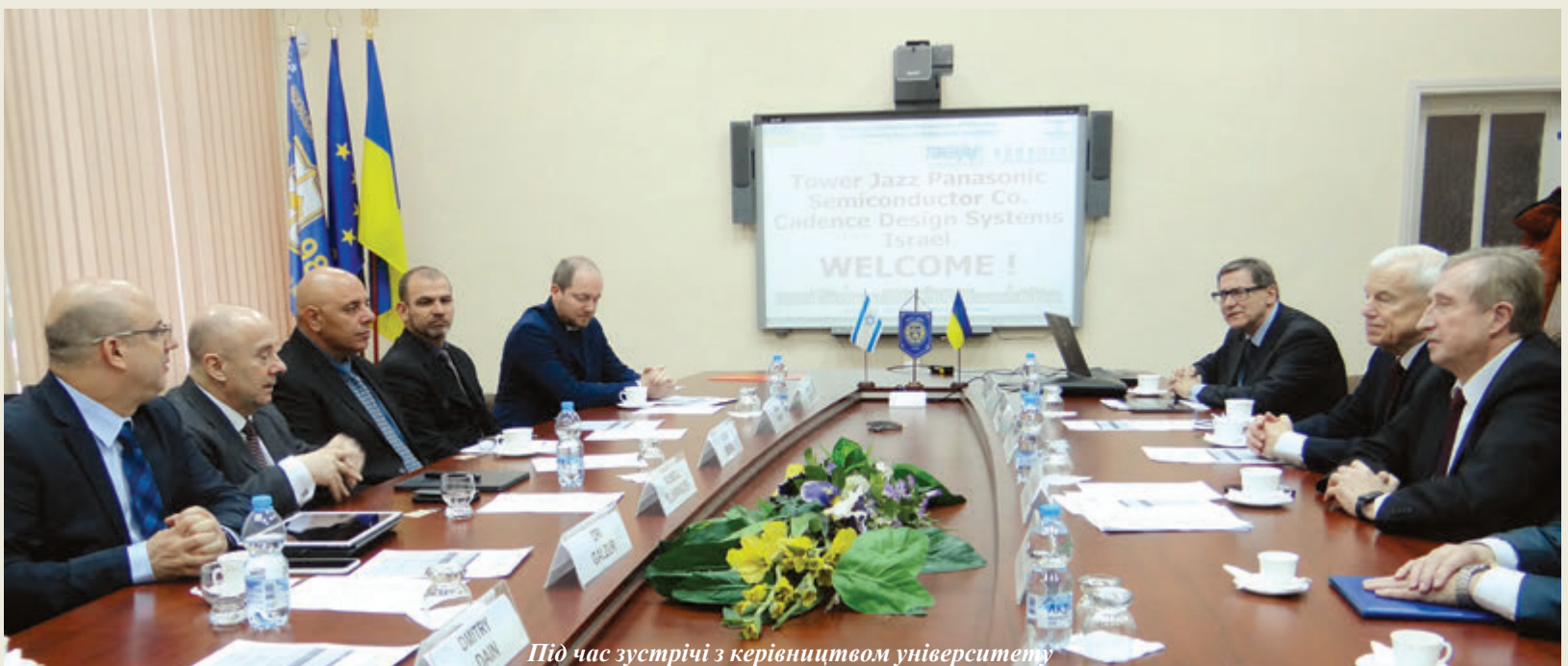
Під час зустрічі з керівництвом університету