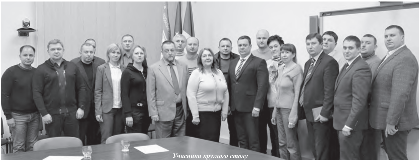
Учасники круглого столу