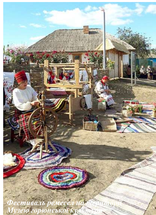
Фестиваль ремесел на території Музею горюньської культури