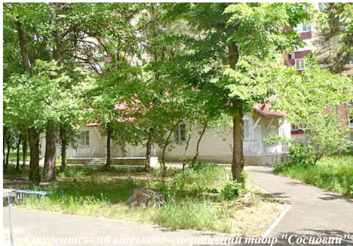
Студентський військово-спортивний табір "Сосновий"

Звертаємо увагу на особливості оздоровчого сезону 2020. Адміністрація виконує всі вимоги щодо протиепідемічних заходів: на кожен базу закуплено необхідну кількість антисептиків, пірометрів, медичних масок. Регулярно, декілька разів на день, здійснюватиметься обробка антисептичними засобами приміщень для проживання і місць загального користування. В їдальнях дотримувати-