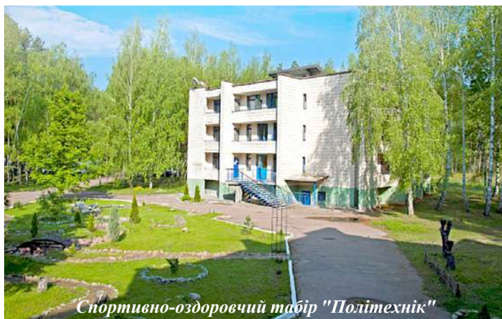
Спортивно-оздоровчий табір "Політехнік"

Цього року бронювання путівок на бази відпочинку здійснюється онлайн на сайті: https://relax.kpi.ua/bronyuvannya-putivok/ . Дізнаватися деталі можна в розділі "Оздоровлення 2020" ( https://relax.kpi.ua/session2020/ ).