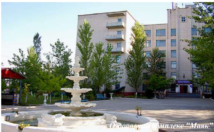
Оздоровчий комплекс "Маяк"

Оздоровчий комплекс "Маяк" – база відпочинку на березі Чорного моря, у смт. Лазурне Херсонської області. Тут на відпочивальників чекають яскраве сонце, тепле море, великий піщаний пляж. Політехніків розселяють у шестиповерховому корпусі, за кілька десятків метрів від пляжної зони, в одно- та двокімнатних номерах на дві-чотири особи з усіма вигодами. Студенти мешкають у чоти-