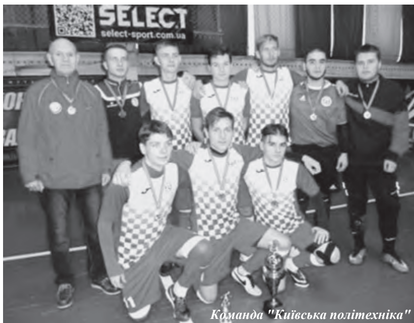
Команда "Київська політехніка"