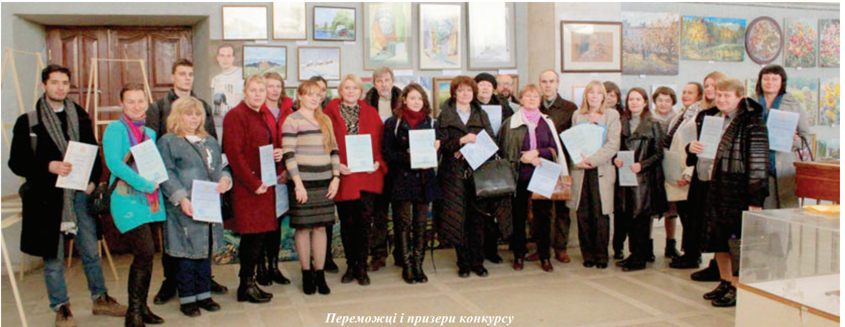
Переможці і призери конкурсу

18 грудня відбулося закриття щорічного мистецького конкурсу "Таланти КПІ". Виставка робіт, представлених на ньому, проходила у виставковій залі корпусу № 7 з 11 листопада. Участь у конкурсі взяли 67 конкурсантів. Студенти, викладачі, науковці та працівники КПІ ім. Ігоря Сікорського, учасники студії "Гармонія" при ЦКМ університету представили загалом близько 300 творів. Як і завжди, серед конкурсантів були учасники, які не вперше виставляли свої роботи, а також ті, з іменами яких глядачі знайомилися вперше. Загалом конкурс сприяв активізації художньої творчості та культурному зростанню студентської молоді, викладачів та працівників університету.