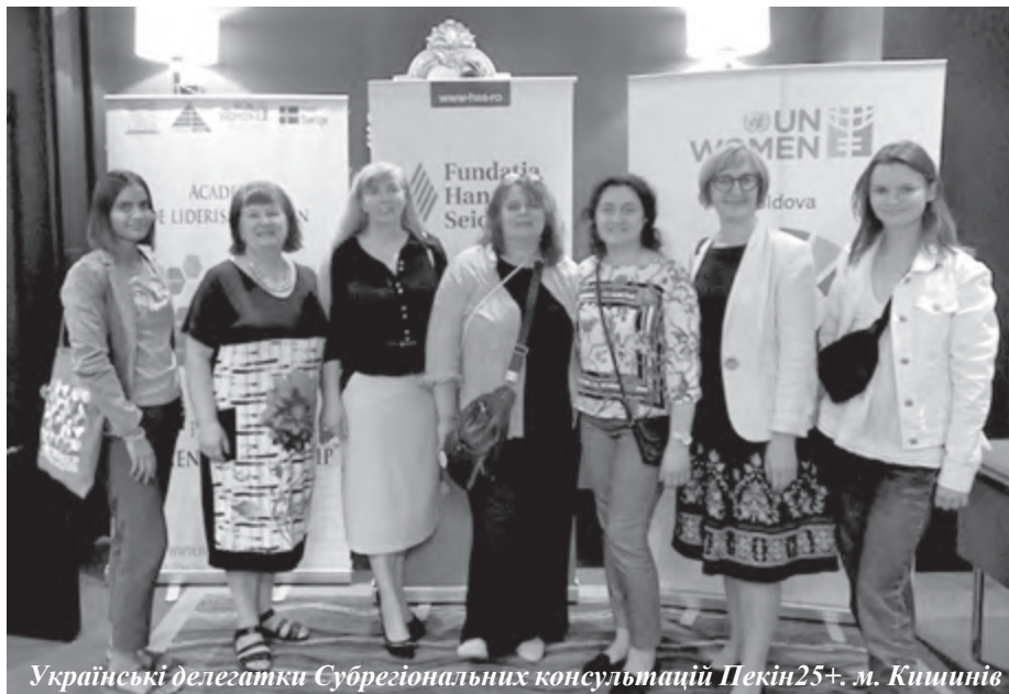
Українські делегатки Субрегіональних консультацій Пекін25+. м. Кишинів

цю декларацію, так і міжнародного співтовариства. З того часу уряди країн звітують про вжиті заходи щодо розширення можливостей і поліпшення становища жінок. Аналітику, що стосується усіх проблемних областей Пекінської платформи дій, готують урядові комітети, наукові установи, громадські організації, міжнародні агентства та приватні компанії. Науковці з КПІ ім. Ігоря Сікорського залучені до підготовки аналітичних звітів, експертних рад, рецензування та опонування за гендерною тематикою. Наш університет має потужний інтелектуальний потенціал для розробки стратегій і практик, спрямованих на досягнення гендерної