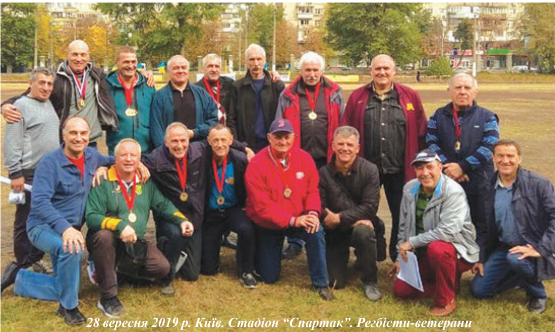
28 вересня 2019 р. Київ. Стадіон "Спартак". Регбісти-ветерани