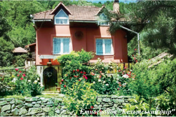
Етносадиба "Кельтський двір"