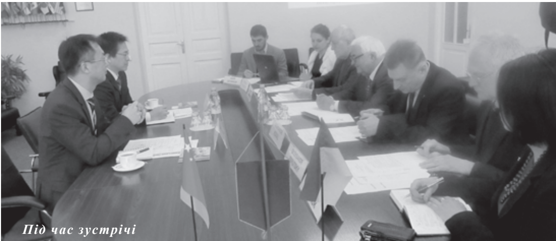
Під час зустрічі

17 лютого 2017 року КПІ ім. Ігоря Сікорського відвідала делегація представників Посольства КНР в Україні в особі Першого секретаря Посольства КНР в Україні Чжан Вея та Першого секретаря Посольства КНР в Україні Ван Цзіньго, який є куратором співпраці КНР та України у сфері науки та освіти.