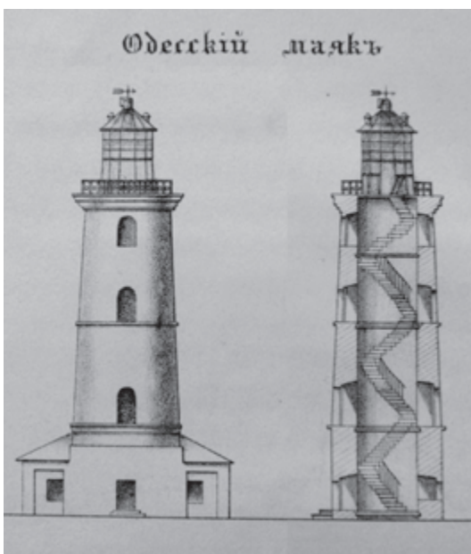
Ілюстрація з книги "Описание маяков и знаков Черного и Азовского морей"