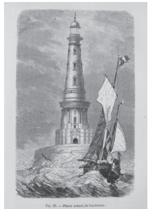
Fig. 15. — Phare actuel de Cordouan.