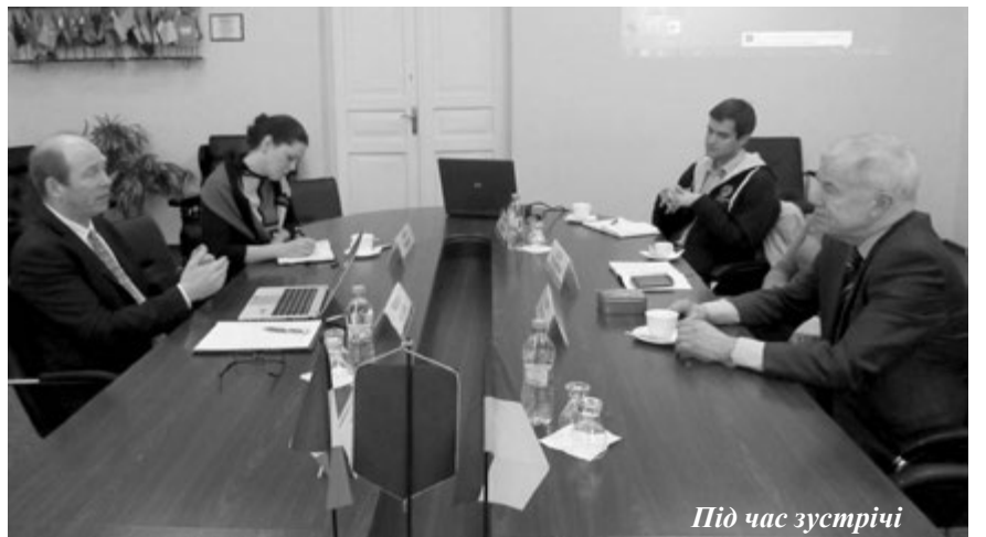
Під час зустрічі