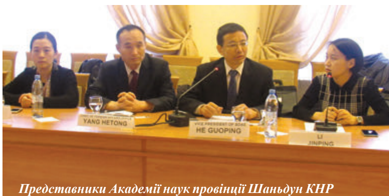
Представники Академії наук провінції Шаньдун КНР