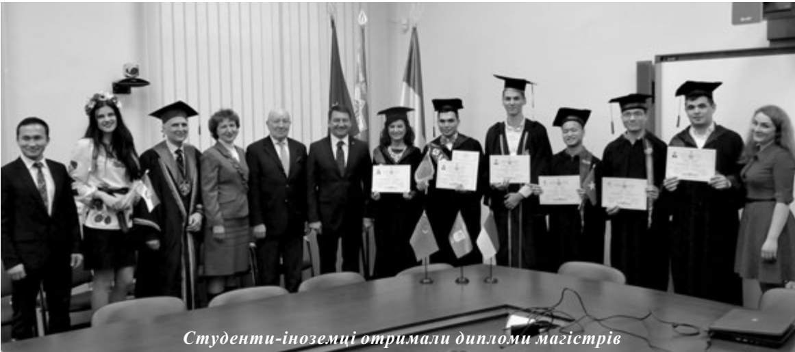
Студенти-іноземці отримали дипломи магістрів

В останній день зими відбулись урочистості з нагоди вручення дипломів магістра іноземним громадянам, випускникам факультету менеджменту та маркетингу і факультету соціології і права НТУУ "КПІ".