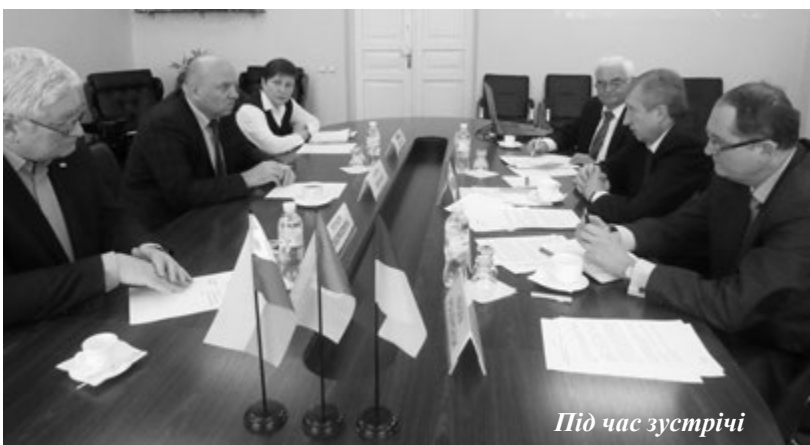
Під час зустрічі