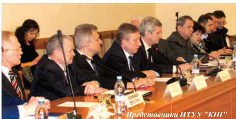
Представники НТУУ "КПІ"