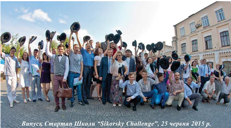
Випуск Стартап Школи "Sikorsky Challenge", 25 червня 2015 р.

Участь у програмі Стартап Школи полягає в проходженні одного, двох або трьох її ступенів: