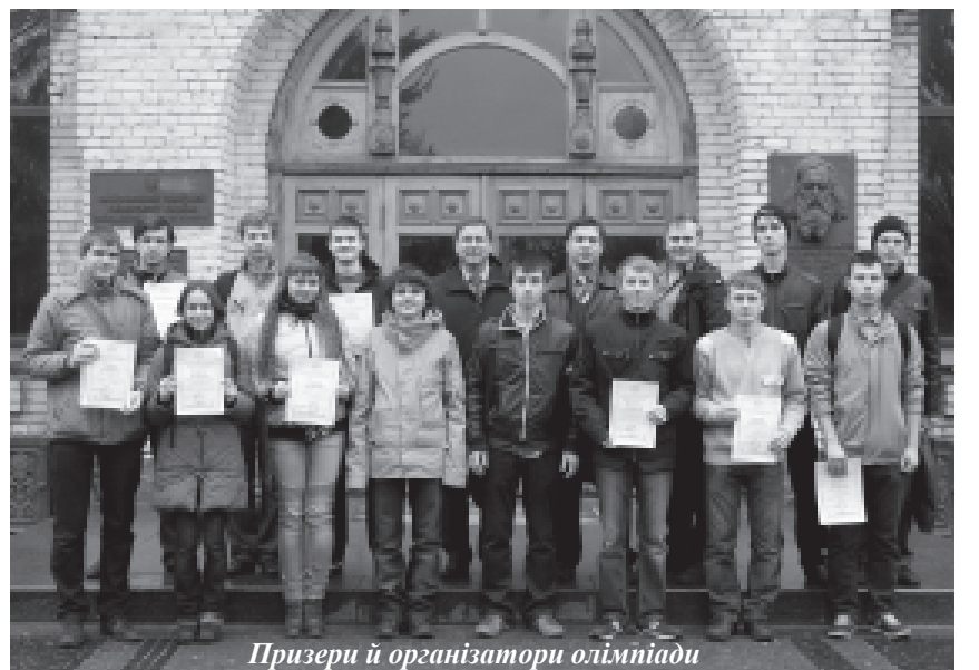
Призери й організатори олімпіади