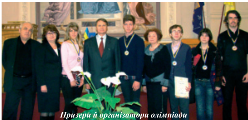
Призери й організатори олімпіади

З 2 по 5 квітня 2012 року в нашому університеті на базі факультету соціології і права вперше пройшла Всеукраїнська студентська олімпіада з культурології.