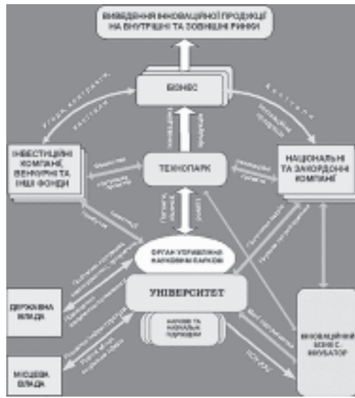
Організаційна структура Наукового парку

– Що ж потрібно змінити в країні, щоб вона почала рухатися шляхом інноваційного розвитку?