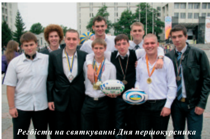
Регбісти на святкуванні Дня перцюкурника