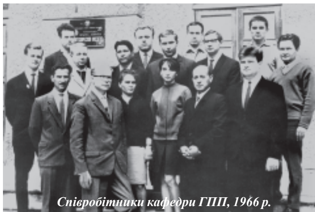
Співробітники кафедри ГПП, 1966 р.