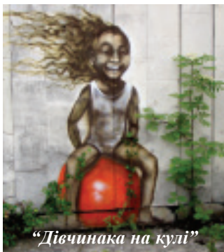
«Дівчина на кулі»