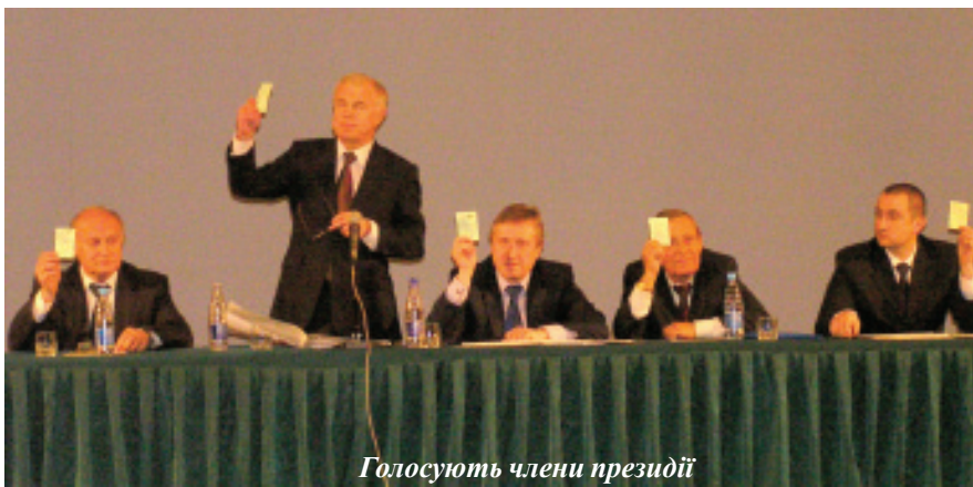
Голосують члени президії

року по квітень 2011 року. Проект Колективного договору протягом двох місяців готувала комісія у складі представників адміністрації і профкомів.