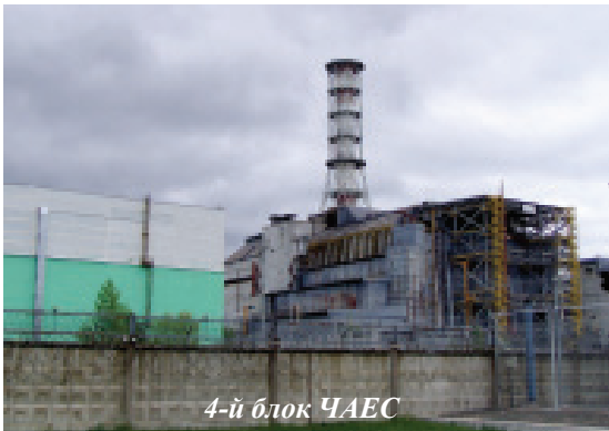
4-й блок ЧАЕС

Щорічно наприкінці квітня багато жителів нашої планети, особливо України, Білорусі й Росії, згадують ті страшні весняні дні 1986 року, коли величезні території з унікальним рослинним і тваринним світом раптом стали