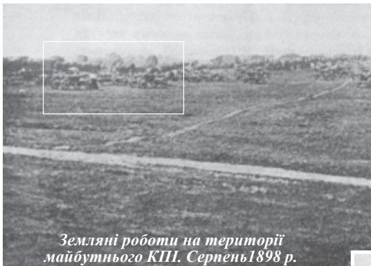
Земляні роботи на території майбутнього КПІ. Серпень 1898 р.