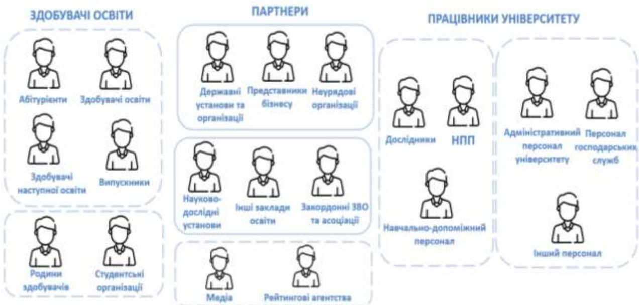
Рис. 2. Карта користувачів, стейкхолдерів

Важливим аспектом удосконалення функціонування ІКР є розуміння цільової аудиторії кожного з каналів комунікації, а отже, і формування стратегії розвитку ресурсів. Університет є складним багатофункціональним утворенням, що формує складну та розгалужену карту користувачів та стейкхолдерів загалом. Важливо розуміти, що залучення стейкхолдерів університету є важливим пріоритетом на сьогодні. Тому, вважаємо за доцільне схематично зобразити карту користувачів вебсайтів та інших ІКР університету, які відображають його різноманітні комунікації та діяльність.